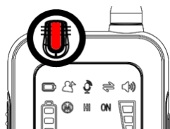
Rojo Carga en curso

PASO 4. Los dispositivos Okayo EZtour estarán completamente cargados cuando los LED se vuelvan azules.