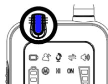
Azul Dispositivo completamente cargado