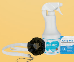
Accessoires d'hygiène liquides désinfectants, housses et cordons tour de cou