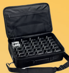
Mallette de transport TB-350 pour 30/50 appareils