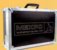
Valise de transport AC-360 jusqu'à 60 appareils