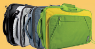
Mallette de transport TBX-2 pour 50 appareils