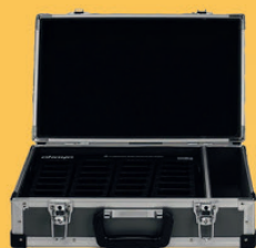
Chargeur sans fil HDC-324 pour 24 appareils