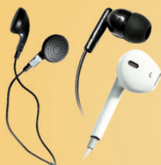
Écouteurs jetables intra-auriculaires et semi intra-auriculaire