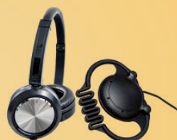
Écouteurs réutilisables supra-auriculaires et serre-tête