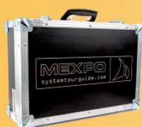
Valigia da trasporto AC-360 fino a 60 dispositivi