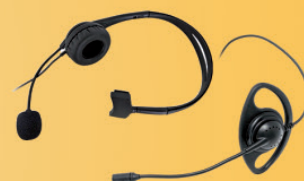
Cuffie con microfono con archetto dietro la testa, sulla testa, sovrauricolari