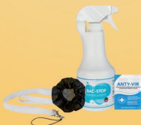
Accessori per l'igiene liquidi disinfettanti, cappucci e cordoncini